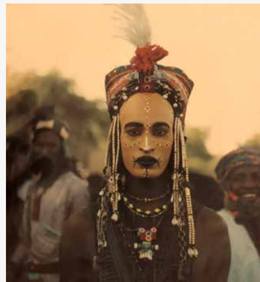
Vinderen af Djuulde Gaani -ceremonien, november 1990.