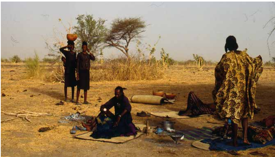
WoDaaBe slår lejr, Niger 1992. Mændene arrangerer deres soveplads: en tynd palmebladmåtte til hver, og der brygges te efter en hel dags hårdt arbejde (se den lille lyseblå tekande med te fra Kina). I baggrunden står to kvinder og venter ydmygt, parate til at give mændene mælk i den store kalabas.