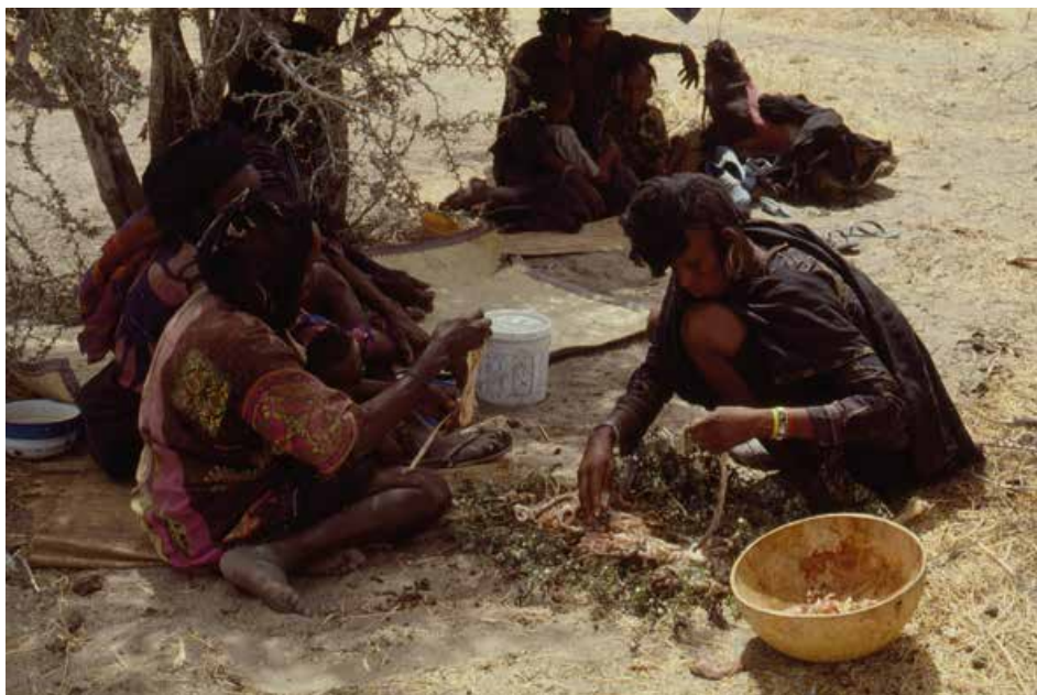
Mormor Daada og en niece tilbereder tarm-indvolde efter slagning af et får: en delikatesse. 1987.

prøve dragterne og holde tingene i hænderne: "De er ægte! Og fra Afrika!". Børnene måtte også bruge den jernhakke, jeg havde købt i Nigeria, i den danske muld. Det syntes eleverne var herligt, og jeg syntes, det var herligt.