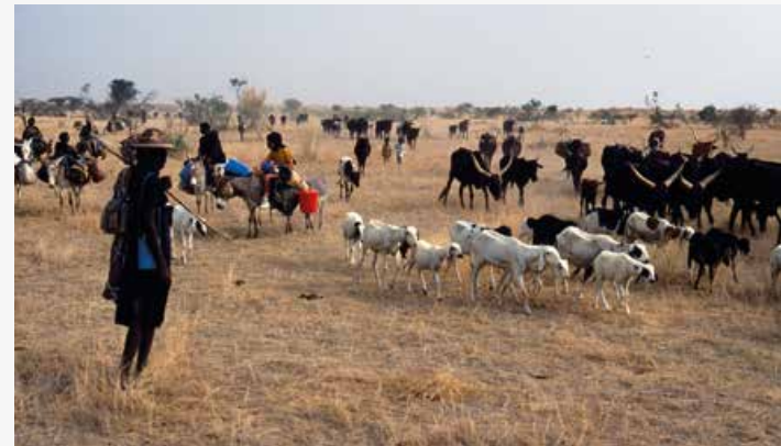
Storfamilien har vandret 25 km til den nye boplads på en dag. Kvinder og børn rider på æsler, mænd er til fods.